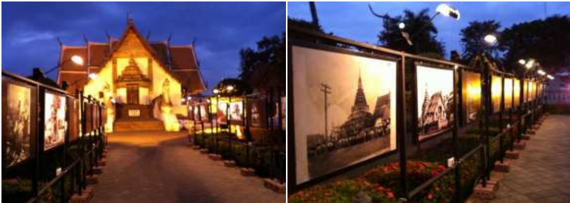
ภาพการจัดนิทรรศการ"ภาพถ่ายโบราณน่าน"ที่บริเวณหน้าวัดภูมินทร์ จ.น่านเป็นการร่วมมือระหว่างหอภาพถ่ายล้านนาและ องค์การบริหารพื้นที่พิเศษเพื่อการท่องเที่ยวแบบยั่งยืน สาขาน่าน ตั้งแต่วันที่ 1 พฤศจิกายน พ.ศ.2558 ถึง 31 มีนาคม พ.ศ.

ในส่วนของการมีส่วนร่วมในระดับชาตินั้น ทางหอภาพถ่ายล้านนาได้ร่วมมือกับองค์กรใหญ่ระดับชาติ ทั้งของราชการและเอกชนหลายองค์กรด้วยกัน ตัวอย่างเช่น องค์การบริหารพื้นที่พิเศษเพื่อการท่องเที่ยวแบบยั่งยืน(อพท.) ได้ร่วมมือกับหอภาพถ่ายล้านนาในการลงเก็บภาพถ่ายโบราณเมืองน่าน และจัดนิทรรศการ บริเวณกลางเมืองน่าน หรือหอภาพถ่ายล้านนาร่วมกับสถาบันวิจัยดาราศาสตร์แห่งชาติ (องค์การมหาชน) ในการจัดอบรมแก่นักศึกษาและประชาชนทั่วไปในการถ่ายภาพทางดาราศาสตร์ หรือกับศูนย์สร้างสรรค์งาน ออกแบบ (Thailand Creative & Design Center หรือที่เรียกกันทั่วไปว่า TCDC ) ที่ให้ความร่วมมือกันในหลายมิติด้วยกัน ตัวอย่างเช่นในเดือนธันวาคม พ.ศ.2559 นี้ทางหอภาพถ่ายล้านนาได้ร่วมมือกับทาง TCDC โดยการให้พื้นที่ในการจัดงาน Chiangmai Design week ที่หอภาพถ่ายล้านนา เพราะการร่วมมือกับองค์กรใหญ่ระดับชาตินั้นเพื่อให้เกิดความร่วมมือรวมถึงการแลกเปลี่ยนในหลากหลายช่องทาง เช่นการแลกเปลี่ยนองค์ความรู้หรือการแลกเปลี่ยนข้อมูล เป็นต้น นอกจากนี้ทางหอภาพถ่ายล้านนาได้ร่วมมือกับเอกชนด้วยเช่นกัน ซึ่งหอภาพถ่ายล้านนาได้คัดสรรในการมีส่วนร่วมกับเอกชนอย่างมาก ตัวอย่างเช่นร่วมมือกับสำนักพิมพ์ ริเวอร์บุ๊ก ซึ่งเป็นสำนักพิมพ์ที่มีคุณภาพจัดพิมพ์หนังสือเกี่ยวกับประวัติศาสตร์ที่ทรงคุณค่าเป็นส่วนใหญ่ โดยที่มีการร่วมมือในการจัดนิทรรศการภาพถ่ายโบราณของ จอห์น ทอมสัน ซึ่งนำมาจัดที่หอศิลปวัฒนธรรมเมือง เชียงใหม่ เป็นการนำภาพถ่ายโบราณหายากนำมาให้องค์ความรู้แก่ชาวเชียงใหม่ การร่วมมือขององค์กรระดับชาตินั้นถือว่าประสบความสำเร็จแม้เปิดทำการมาแค่เพียงสามปี ทั้งนี้เพื่อให้เป็นที่รู้จักและการมีอยู่ของหอภาพถ่าย ล้านนา