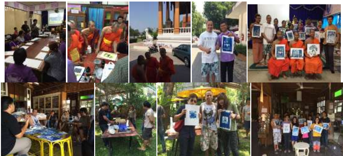
ภาพ การจัดการอบรมการอัดภาพด้วยกระบวนการไฮยาโนไทป์ แก่ประชาชนทั่วไปในเมืองน่าน เพื่อเป็นการเพิ่มมูลค่าแก่ ผลิตภัณฑ์ เป็นการร่วมมือระหว่างหอภาพถ่ายล้านนาและองค์การบริหารพื้นที่พิเศษเพื่อการท่องเที่ยวแบบยั่งยืน สาขาน่าน เมื่อวันที่ 20-22 กุมภาพันธ์ พ.ศ.2558

จะเห็นได้ว่าในฐานะของผู้ก่อตั้งหอภาพถ่ายล้านนาได้วางแนวทางในการดำเนินงาน ตามความรู้ ความสามารถที่เชี่ยวชาญ และสามารถนำออกมาใช้ได้อย่างเต็มศักยภาพ ก่อให้เกิดประโยชน์แก่สังคมอย่าง ครบถ้วนตามภารกิจที่หอภาพถ่ายล้านนาพึงกระทำ