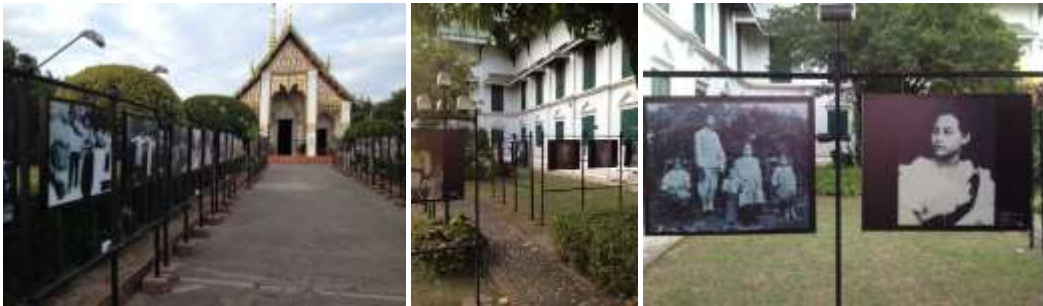
ภาพการจัดนิทรรศการ "ภาพถ่ายโบราณนาน" ที่บริเวณหน้าวัดช้างค้ำวรวิหาร จ.น่านและบริเวณหน้าพิพิธภัณฑ์สถานแห่งชาติ น่านเป็นการร่วมมือระหว่างหอภาพถ่ายล้านนาและองค์การบริหารพื้นที่พิเศษเพื่อการท่องเที่ยวแบบยั่งยืน สาขาน่าน ตั้งแต่วันที่ 1 พฤศจิกายน พ.ศ.2558 ถึง 31 มีนาคม พ.ศ.2559

- การจัดการอบรมและบรรยาย การจัดอบรมที่ทางหอภาพถ่ายล้านนาได้ดำเนินการมาแล้ว มีทั้งในและนอกสถานที่ และได้ดำเนินการมาอย่างสม่ำเสมอ ทั้งนี้เพื่อเป็นการสร้างองค์ความรู้แก่ชุมชนโดยตรง การจัดอบรมนั้นเรื่องที่น่าไปจัดจะเป็นการนำภาพถ่ายโบราณไปใช้ให้เกิดประโยชน์ ตัวอย่างเช่นการนำภาพถ่ายโบราณมากลับมาทำใหม่บนกระบวนการที่เรียกว่า อัดภาพแบบไซยาโนไทด์ เป็นการอัดภาพใช้น้ำยาพิเศษทา ลงบนวัสดุที่น้ำยาสามารถซึมลงไปได้เช่นผ้าและนำภาพถ่ายโบราณมาเป็นต้นแบบ ก็สามารถทำภาพถ่ายติดอยู่ บนวัสดุนั้นๆ ผู้อบรมสามารถนำไปต่อยอดเพื่อเพิ่มมูลค่าของสินค้าที่สามารถนำไปจำหน่ายแก่นักท่องเที่ยวได้ นอกจากนี้ยังเชิญวิทยากรพิเศษมาบรรยายแก่นักศึกษาในการทดลองถ่ายภาพแบบต่างๆ เช่นการถ่ายภาพด้วย กล้องรูเข็ม เป็นต้น ในส่วนของการบรรยายนั้นทางหอภาพถ่ายล้านนาได้ดำเนินการมาโดยตลอด มีการเชิญ วิทยากรจากทั้งจากในประเทศและนอกประเทศมาบรรยายในเรื่องเกี่ยวกับภาพถ่าย ซึ่งการจัดบรรยายพิเศษนี้ ทางหอภาพถ่ายจะจัดไม่ต่ำกว่าปีละ 4-5 ครั้ง มีผู้เข้าร่วมครั้งละประมาณ 40-60 คนทุกๆครั้ง และจากผล สำนวจความความคิดเห็นว่าการจัดมีประโยชน์อย่างมากเป็นการเพิ่มพูนความรู้และประสบการณ์ใหม่ๆแก่ผู้เข้าร่วม