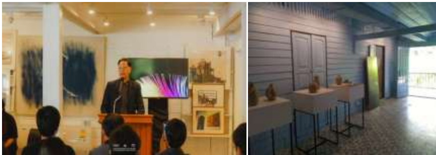
ภาพ การร่วมมือกับศูนย์สร้างสรรค์งานออกแบบ (Thailand Creative & Design Center หรือที่เรียกกันทั่วไปว่า TCDC) ในการจัดงาน Chiangmai Design week ตั้งแต่วันที่ 3-11 ธันวาคม พ.ศ.2559