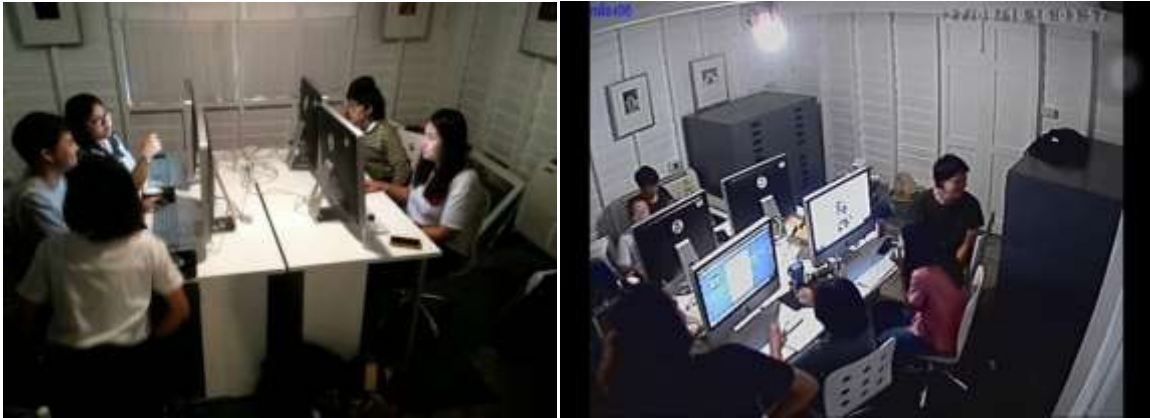
ภาพนักศึกษารหัส 58และรหัส 59 ขณะร่วมกันทำงานในห้องสมุดดิจิทัลภายในหอภาพถ่ายล้านนา

ด้วย ทำให้นักศึกษามีเอกลักษณ์เฉพาะตน ในส่วนของด้านอื่นๆเช่นการจัดทำข้อมูลและเทคโนโลยีที่เกี่ยวข้องกับภาพถ่าย นอกจากนี้ยังฝึกฝนให้นักศึกษาศาขาศิลปะการถ่ายภาพให้มีทั้งทักษะและจิตสำนึกในการให้บริการชุมชน ตั้งแต่การจัดนิทรรศการภาพถ่ายเพื่อรับใช้สังคม หรือแม้แต่การให้ข้อมูลแก่ผู้เยี่ยมชมทั้งภาษาไทย ภาษาอังกฤษและภาษาจีน