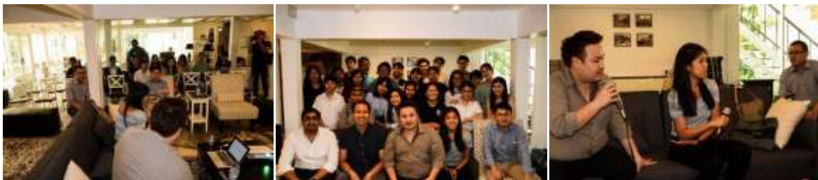
ภาพ การจัดอบรมให้ความรู้แก่นักศึกษาและประชาชนทั่วไปจากเว็บไซต์ชื่อดัง Agoda ในการใช้สื่อให้เกิดประโยชน์เมื่อวันที่ 21 เมษายน พ.ศ.2559