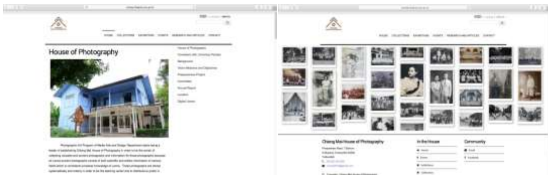
ภาพ เว็บไซต์ของหอภาพถ่ายล้านนา ขณะนี้กำลังรอทาง Thomson Reuter รับรองและจัดอันดับ

ในส่วนการให้บริการวิชาการแก่สังคมนั้น ทางหอภาพถ่ายล้านนาได้จัดการบริการวิชาการด้วยกัน 2 รูปแบบคือ