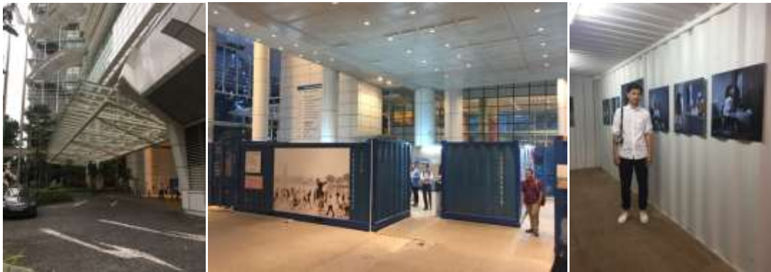
ภาพ การร่วมมือของหอภาพถ่ายล้านนากับกลุ่ม SIFP(Singapore International Photography Festival)ในการคัดเลือกผลงานนักศึกษาไปร่วมจัดแสดงภาพถ่ายที่ Singapore National Library ระหว่างวันที่ 2-10 ตุลาคม พ.ศ.2559

กลุ่มที่เป็นพันธมิตรหอศิลป์และกลุ่มที่จัดเฉพาะกิจกรรม ในการแลกเปลี่ยนและช่วยการจัดนิทรรศการร่วมกัน ในกลุ่มนี้มีจำนวนค่อนข้างมากเพราะเป็นการนำทั้งผลงานของหอภาพถ่ายและของนักศึกษา คณาจารย์ นำไปจัดนิทรรศการร่วมกัน โดยมีรายนามในกลุ่มนี้เช่น SIFP (Singapore International Photography Festival), Obscura Penang Photo Festival ปีนัง ประเทศมาเลเซีย, FCC Angkor Photo Festival เสียมเรียบ ประเทศกัมพูชา