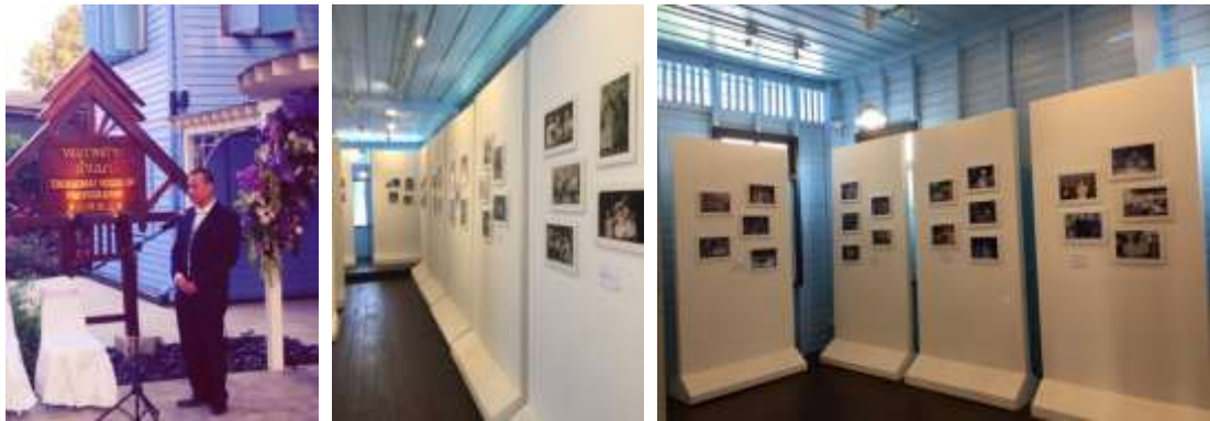
ภาพ งานวันเปิดหอภาพถ่ายล้านนาและนิทรรศการ”เจ้ากอแก้ว ปรากฏกาวิล ณ เชียงใหม่”เมื่อ 20 กุมภาพันธ์ พ.ศ.2557

ได้หันมาสนใจให้ความสำคัญแก่ภาพถ่ายโบราณในแง่ของการให้องค์ความรู้และเพิ่มพูนประสบการณ์ ตัวอย่างของการจัดนิทรรศการของหอภาพถ่ายล้านนาที่ได้จัดมา ครั้งที่ 1 “ภาพถ่ายเจ้ากอแก้ว ปรากฏกาวิล ณ เชียงใหม่” ใช้เวลาในการจัดแสดง 8 เดือน มีผู้เข้าชมประมาณ หกหมื่นคนเศษ ครั้งที่ 2 “720 ปีกว่าจะมาเป็นเมืองเชียงใหม่” ใช้เวลาการจัดแสดง 8 เดือน มีผู้เข้าชมประมาณ แสนกว่าคน การจัดนิทรรศการที่เข้าร่วมมีกับองค์การบริหารพื้นที่พิเศษเพื่อการท่องเที่ยวแบบยั่งยืน สาขาน่าน ในหัวเรื่อง “ภาพถ่ายโบราณเมืองน่าน” จัดแสดงกลางแจ้งบริเวณหน้าวัดภูมินทร์ หน้าวัดช้างค้ำวรวิหารและหน้าพิพิธภัณฑสถานแห่งชาติน่าน จัดแสดงเป็นเวลา 4 เดือน มีผู้ชมทั้งชาวเมืองน่านเองและนักท่องเที่ยวซึ่งได้รับความสนใจและคำชมเชยทั้งจากผู้ว่าราชการน่านและชาวเมืองน่านเป็นอย่างมาก นอกจากนี้ทางหอภาพถ่ายล้านนายังได้ร่วมมือกับองค์กรอื่นๆ ในการนำนิทรรศการมาจัดที่เชียงใหม่อีกด้วยเช่น นิทรรศการ”สยามผ่านมุมมองของ จอห์น ทอมสัน” เป็นนิทรรศการภาพถ่ายสมัยรัชกาลที่ 4 โดยนายจอห์น ทอมสัน จัดแสดง 25 วัน มีผู้เข้าชมประมาณสี่หมื่นคนเศษ ถือเป็นการจัดนิทรรศการที่หอภาพถ่ายล้านนาร่วมมือกับสำนักพิมพ์ริเวอร์บุ๊ก ที่ประสบความสำเร็จเป็นอย่างดี ซึ่งพันธกิจในการจัดนิทรรศการนี้ทางหอภาพถ่ายล้านนาจะดำเนินการไปตลอดทั้งนี้เพื่อสร้างองค์ความรู้และปลูกจิตสำนึกในด้านต่างๆแก่สังคม