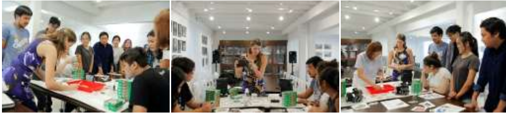
การจัดการอบรมแก่นักศึกษาในหัวข้อ Special Technic : The Emulsion Lift กิจกรรมเวิร์คชอปเทคนิคพิเศษ ในวันที่ 17 ตุลาคม 2558 โดย อ.Patricia Lois Nuss