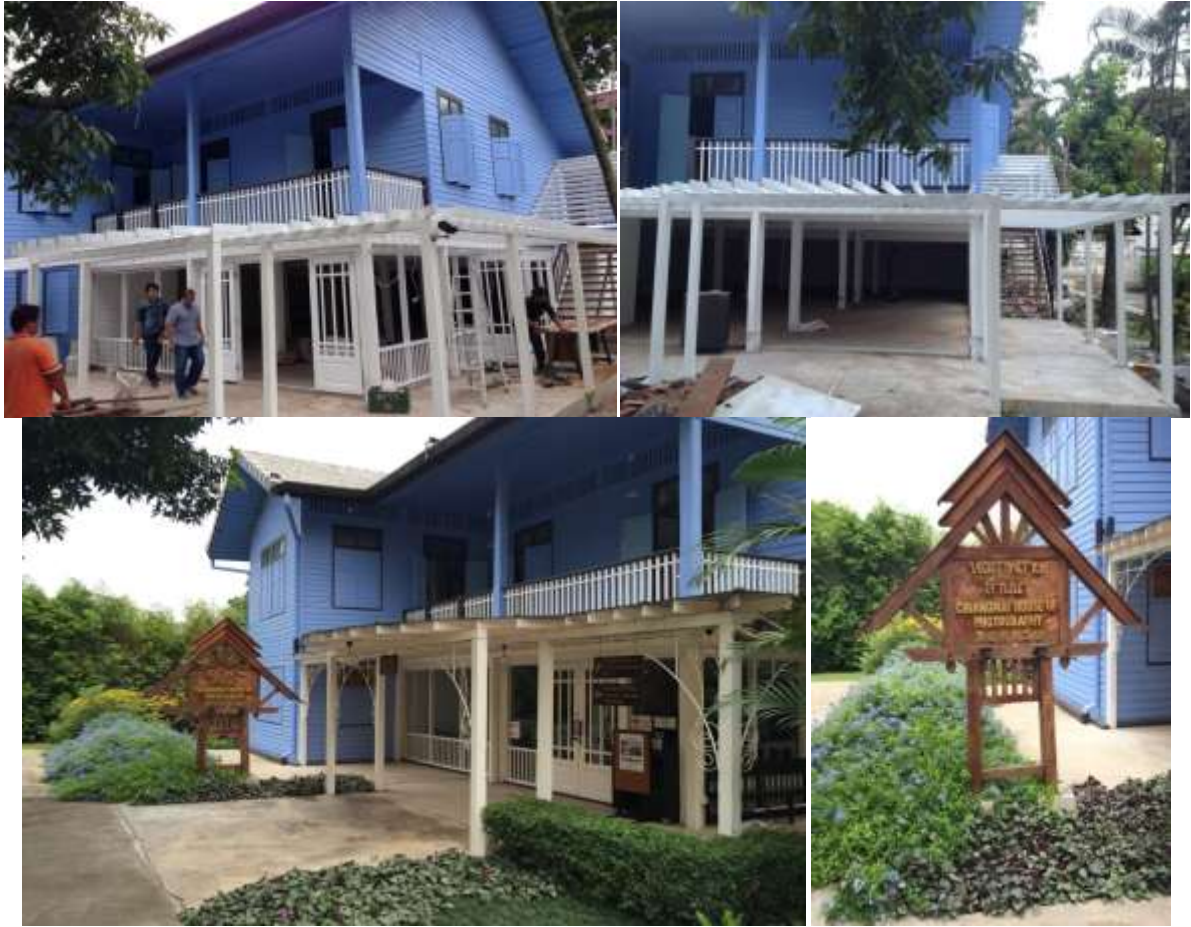
ภาพหอภาพถ่ายล้านนาเมื่อแรกเริ่มตั้งแต่ก่อนการซ่อมแซม จนกระทั่งซ่อมแซมก่อสร้างเสร็จสิ้น