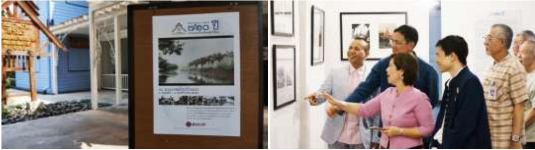
ภาพ งานเปิดนิทรรศการ "720 ปีกว่าจะมา เป็นเมืองเชียงใหม่" โดยผู้ว่าราชการจังหวัดเชียงใหม่ ปวิน ชำนิประศาสน์ เมื่อวันที่ 25 มีนาคม พ.ศ.2559