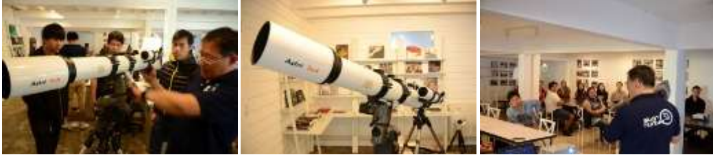
ภาพ การจัดการอบรมการถ่ายภาพดาวให้แก่นักศึกษาและประชาชนทั่วไป เป็นการร่วมมือกันระหว่างหอภาพถ่ายล้านนา กับสถาบันวิจัยดาราศาสตร์แห่งชาติ (องค์การมหาชน) เมื่อวันที่ 31 มกราคม พ.ศ.2559