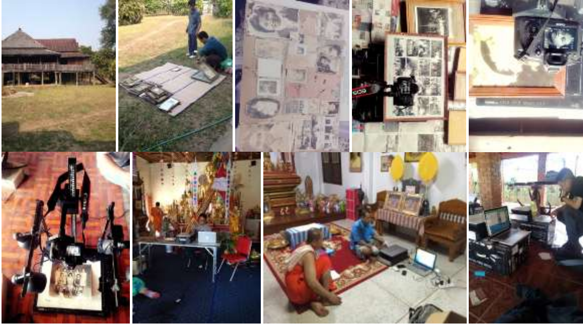
ภาพ การลงวิจัยภาคสนามในการอนุรักษ์และเก็บข้อมูลภาพถ่ายโบราณในเมืองน่าน ซึ่งผู้วิจัยและทีมงานมีความเชี่ยวชาญในการเก็บข้อมูลภาพถ่ายโบราณ ซึ่งการดำเนินการจัดเก็บภาพถ่ายโบราณในเมืองน่านดำเนินการตั้งแต่กลุ่มภาพพันธ พ.ศ.2557 ถึง มกราคม พ.ศ.2558

บริหารพื้นที่พิเศษเพื่อการท่องเที่ยวแบบยั่งยืน สาขาน่านในการลงเก็บภาพถ่ายโบราณในเมืองน่าน หรือการร่วมกับมูลนิธิไร่แม่ฟ้าหลวงในการบันทึกและถ่ายภาพจิตรกรรมฝาผนังวัดเวียงต้า ที่จัดเก็บไว้ที่ไร่แม่ฟ้าหลวง จังหวัดเชียงราย