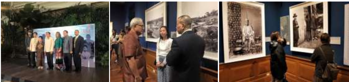
ภาพ การจัดงานนิทรรศการ "สยามผ่านมุมมองของ จอห์น ทอมสัน" เป็นการร่วมมือระหว่างหอภาพถ่ายล้านนากับสำนักพิมพ์รีเวอร์บู้ค ตั้งแต่วันที่ 4-25 กุมภาพันธ์ พ.ศ.2559