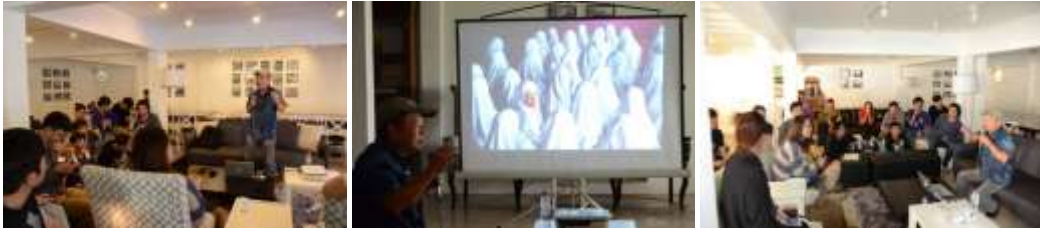
การจัดบรรยาย "มองศิลปะผ่านเลนส์" โดย อาจารย์ วรณันท์ ชวัลกรศิริพากร ศิลปินแห่งชาติ สาขาทัศนศิลป์ (ภาพถ่าย) พ.ศ 2552 ณ หอภาพถ่ายล้านนา เชียงใหม่ วันเสาร์ ที่ 13 ก.พ 2559 เวลา 11:30-16:30