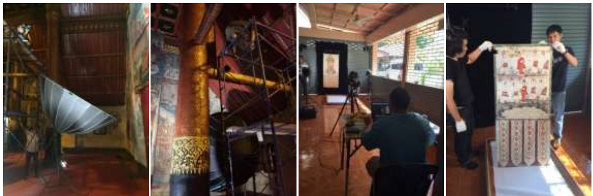
ภาพ ความเชี่ยวชาญที่ข้าพเจ้าได้ทำการฝึกฝนทีมงานในการอนุรักษ์และเก็บข้อมูลภาพจิตรกรรมฝาผนัง สองภาพซ้ายมือเป็นการบันทึกและถ่ายภาพจิตรกรรมฝาผนังวัดภูมินทร์ จ.น่าน และสองภาพขวาเป็นการบันทึกและถ่ายภาพจิตรกรรมผ้าพระบฏของวัดปงสนุก จ.ลำปาง ในส่วนของการจัดเก็บและบันทึกภาพจิตรกรรมฝาผนังในล้านนาทางข้าพเจ้าและหอภาพถ่ายล้านนาเริ่มดำเนินการมาตั้งแต่ปี พ.ศ.2554 และยังคงดำเนินการต่อไปเนื่องจากภาพจิตรกรรมฝาผนังในล้านนายังคงมีเหลืออีกเป็นจำนวนมาก

ซึ่งนอกจากนี้การอนุรักษ์ภาพถ่ายโบราณและภาพถ่ายจิตรกรรมฝาผนังนั้นต้องมีกระบวนการใส่ข้อมูลประกอบภาพถ่าย ( Metadata ) เพื่อให้ภาพถ่ายโบราณและภาพถ่ายจิตรกรรมฝาผนังสามารถนำไปอ้างอิง